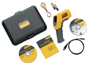
Fluke 568 с комплектом принадлежностей