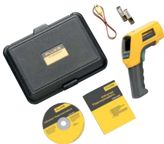
Fluke 566 с комплектом принадлежностей