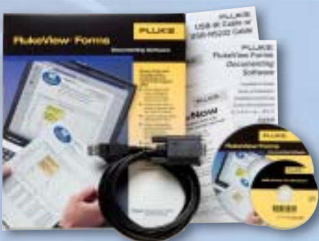
FlukeView® Forms Кабель и программное обеспечение