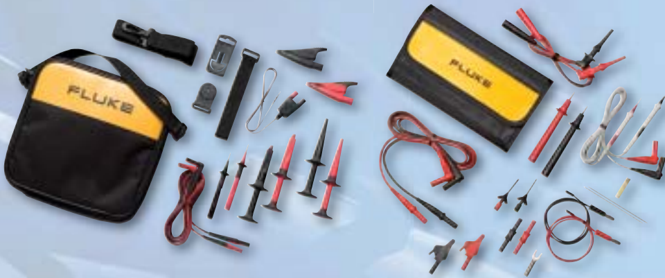
TLK289 Комплект измерительных проводов

Для повышения производительности приборов Fluke 289 и Fluke 287 имеется широкий выбор дополнительных аксессуаров, но следующие принадлежности важны для большинства пользователей.