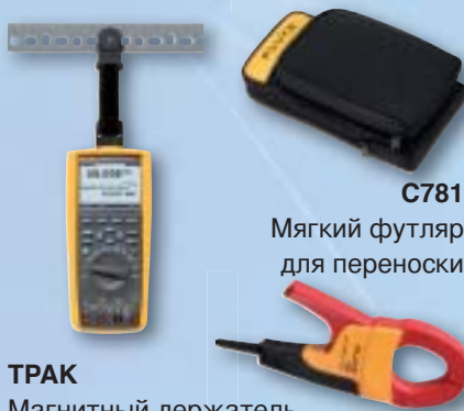
C781 Мягкий футляр для переноски